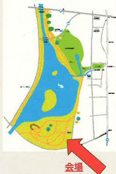
江津湖周遊MAP 下江津編